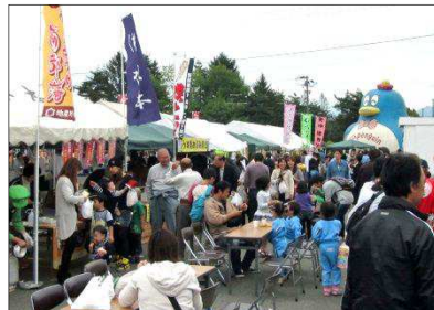
屋台・ふわふわトランポリン