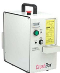
メディア破壊装置